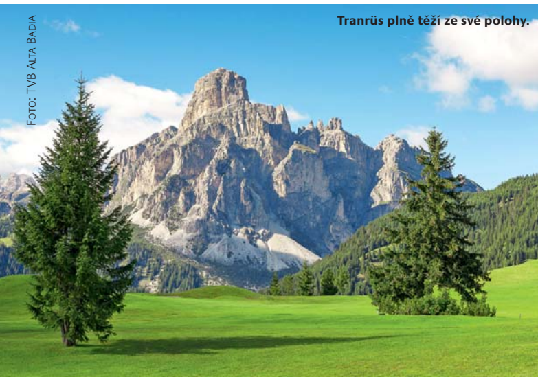
Tranrús plně těží ze své polohy.