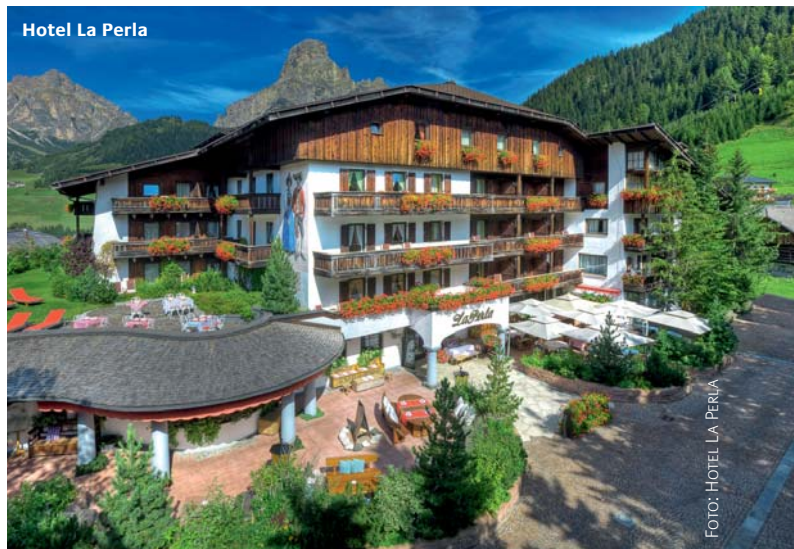
Hotel La Perla